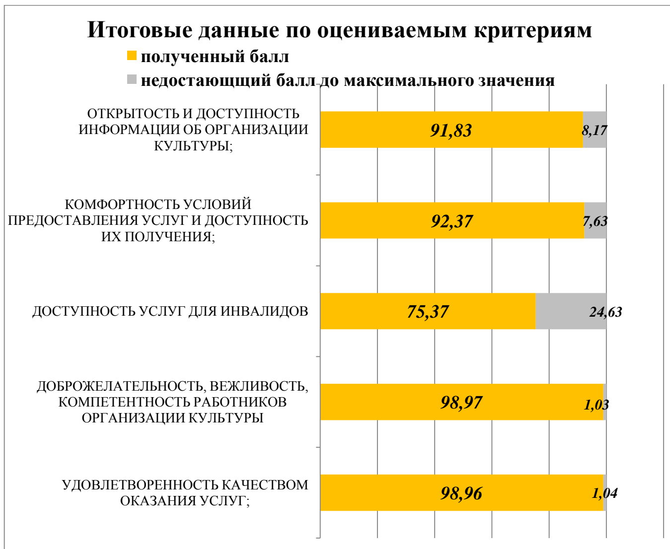
График 2. Итоговые оценки по критериям по региону в целом (вес каждого критерия в баллах).

На Графике 2. приведен вес в баллах каждого критерия.